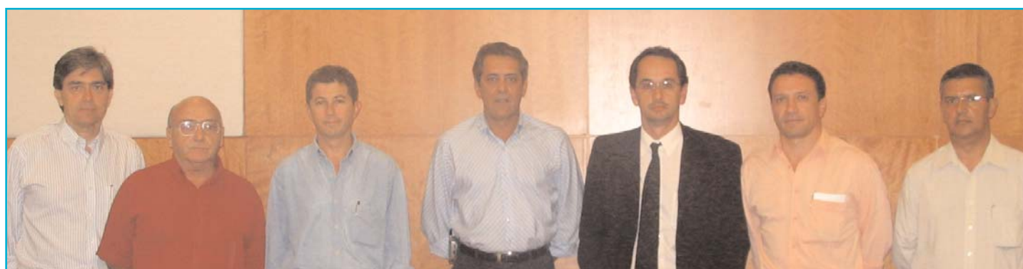
Os distribuidores não associados também foram convidados para reunião com a diretoria