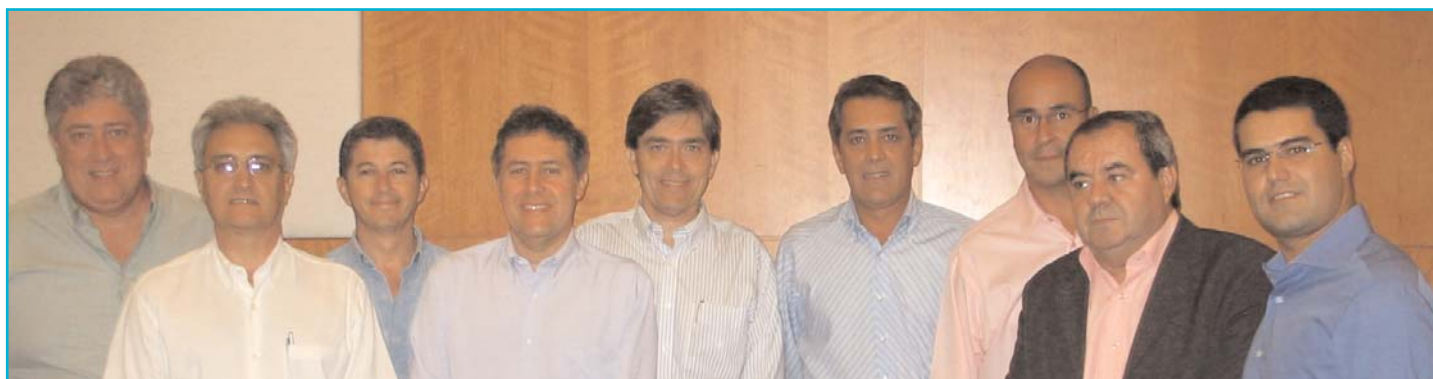
Diretoria da Andipa esteve em Minas Gerais para reunião com os associados